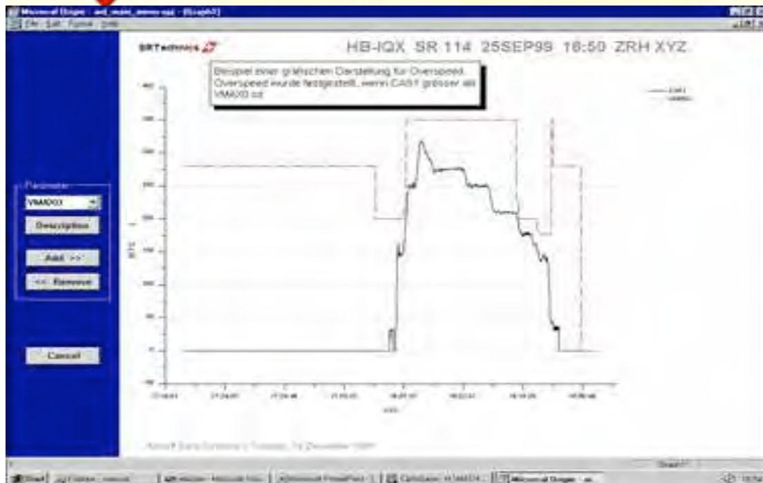
ADAS Daten in ORIGIN mit angepaßter Bedienoberfläche

Alle notwendigen Arbeitsschritte, wie * die Datenbankanbindung * die Automatisierung einzelner Arbeitsschritte * die Verfügbarkeit der Funktionen, wie die Auswahl verschiedener Parameter, Condition Sets etc. über eine eigene Bedienoberfläche mit Windows Steuer- und Kontrollelementen * das Erstellen von Grafiken in eigene, per Mausclick verfügbare Vorlagen (Templates) * ein gleichbleibendes Layout bei der Erstellung von Berichten mit der Möglichkeit zur Präsentation der Ergebnisse über OLE2-Unterstützung